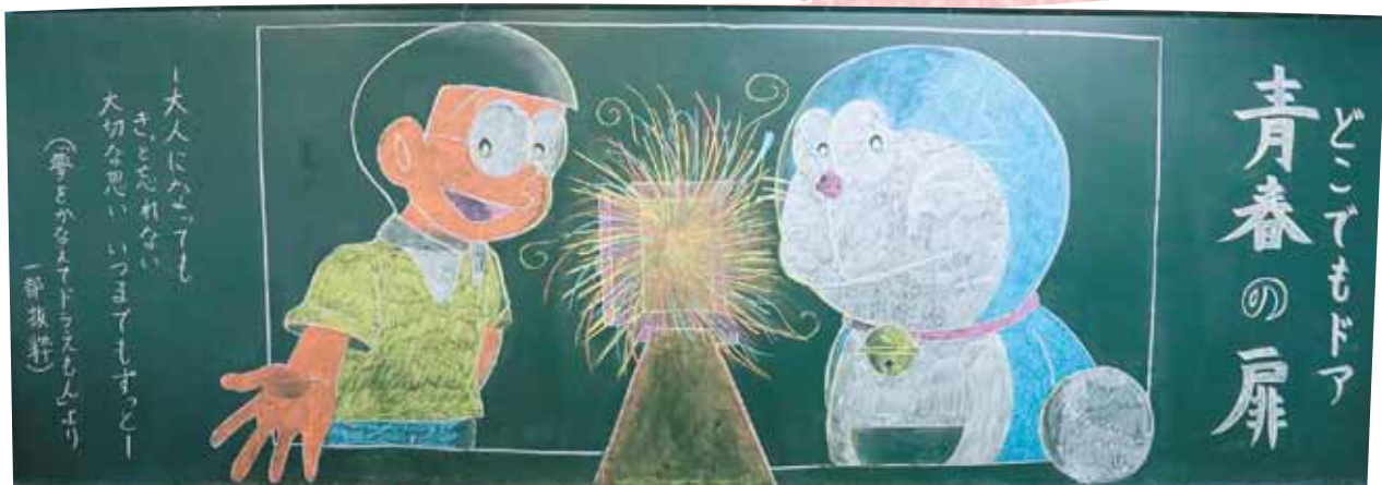
統一祭全校企画「黑板アート」最優秀賞の2年4組の作品です。テーマは青春です。